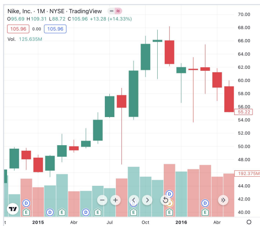
Descenso de acciones de la marca de ropa deportiva Nike.

multinacional de ropa deportiva con oficinas centrales en EEUU" la cuál dió sobornos para patrocinio exclusivo dentro de la FIFA. Esta noticia tuvo un efecto negativo dentro de la bolsa, pues el público pensó inmediatamente en la marca de ropa deportiva Nike, bajando las acciones de Nike por un 1.5%.