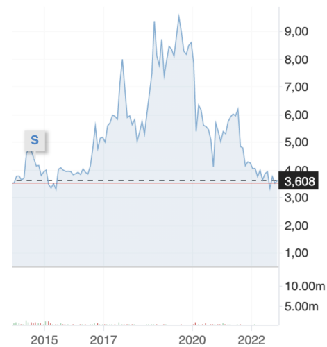
Descenso (s) de acciones en el equipo europeo de fútbol el Borussia Dortmund.

Equipos europeos de fútbol como el Borussia, el Dortmund, el Roma, el Lazio y el Benfica tuvieron una caída en la bolsa seguido al FIFA Gate, logrando caer hasta un 6%, pues aunque no se sepa con exactitud qué tipo de actividades irregulares hayan sido cometidas por estos equipos, varios medios de comunicación como el Espectador y el Economista mencionan que dentro de las filtraciones respecto a las partes relacionadas con este escándalo, estos clubes resaltan, sin especificaciones de cuál fue su involucración, por lo que patrocinadores afiliados a estos equipos dejaron de invertir después de que el caso de hiciera público.