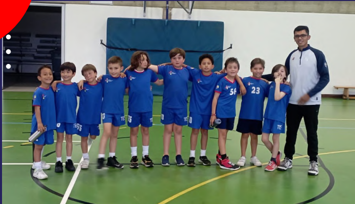
Equipo benjamines masculino en Colegio Andino