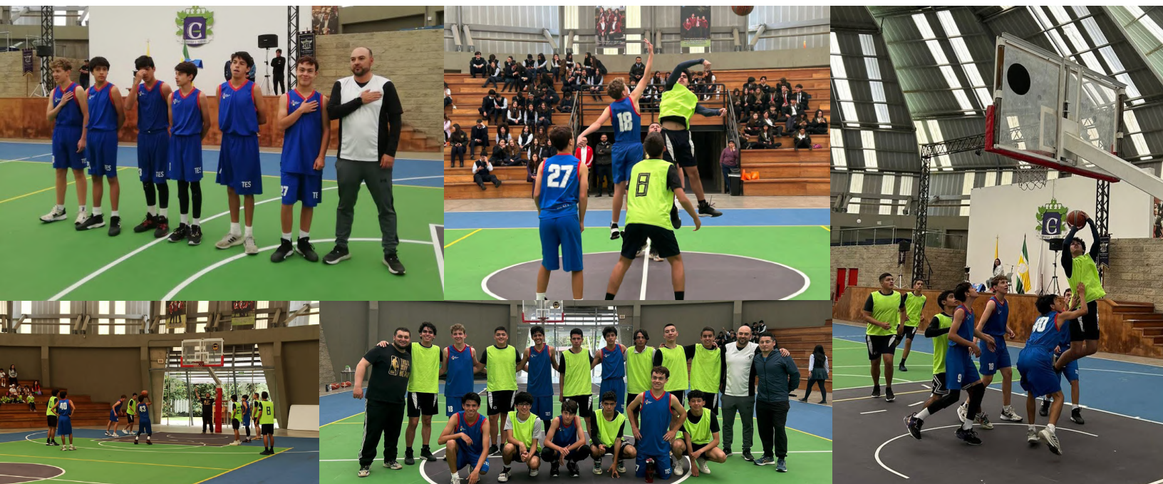
Equipo de baloncesto mayores masculino en Gimnasio Los Cerezos