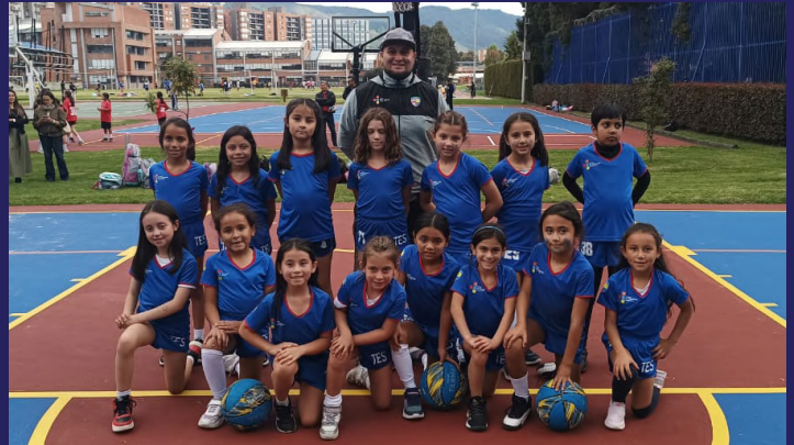
Equipo benjamines femenino