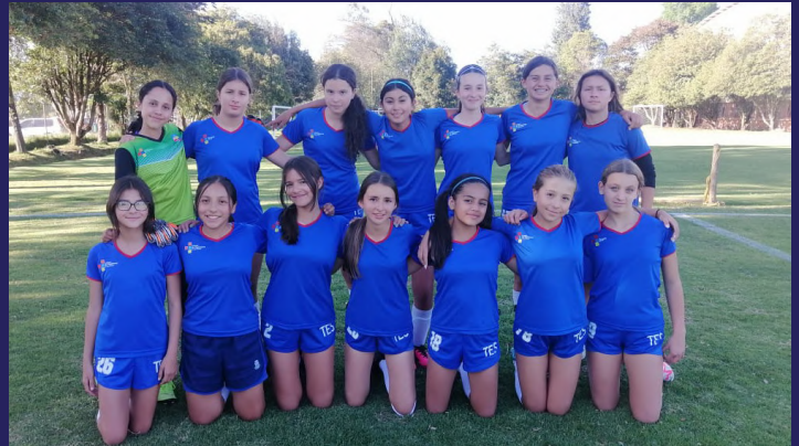
Equipo infantil femenino en Gimnasio Vermont