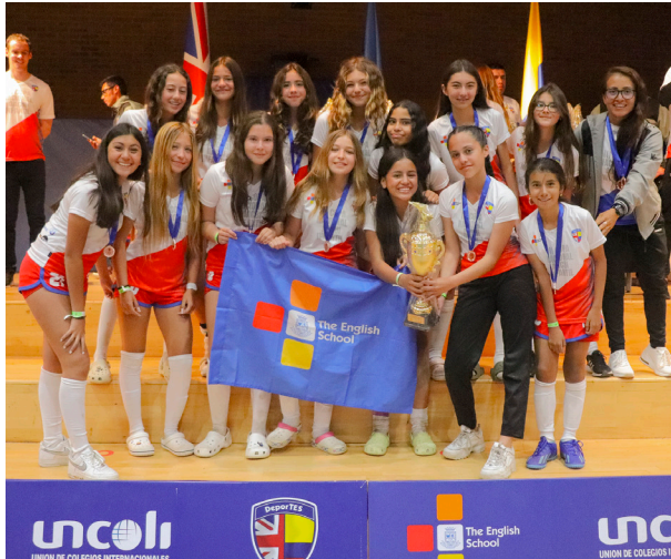
Tercer puesto Copa Oro Equipo fútbol infantil femenino