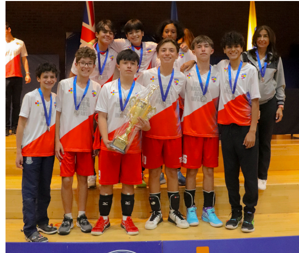
Subcampeones Copa Oro Equipo voleibol infantil masculino