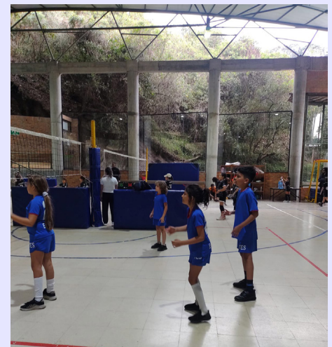
Equipo benjamines femenino y masculino en Colegio Campoalegre