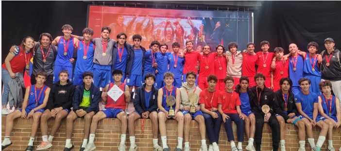
The English School: colegio campeón de la Copa AACBI en la rama masculina

Felicitemos a nuestros equipos de baloncesto, fútbol y voleibol categoría mayores femenino y masculino y a nuestros entrenadores por su excelente desempeño en la Copa AACBI Mayores, realizada en el Gimnasio del Norte.