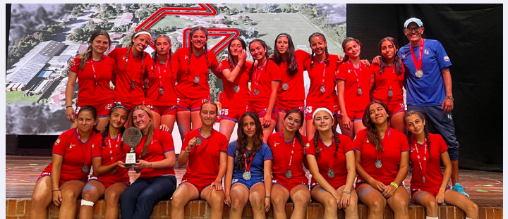
Subcampeonas Equipo de fútbol mayores femenino