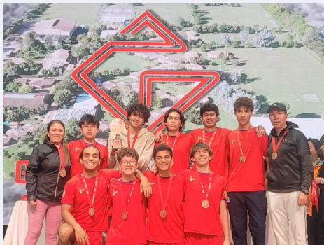
Tercer puesto Equipo de voleibol mayores masculino