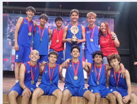
Campeones Equipo de baloncesto mayores masculino