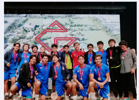
Tercer puesto Equipo de fútbol mayores masculino